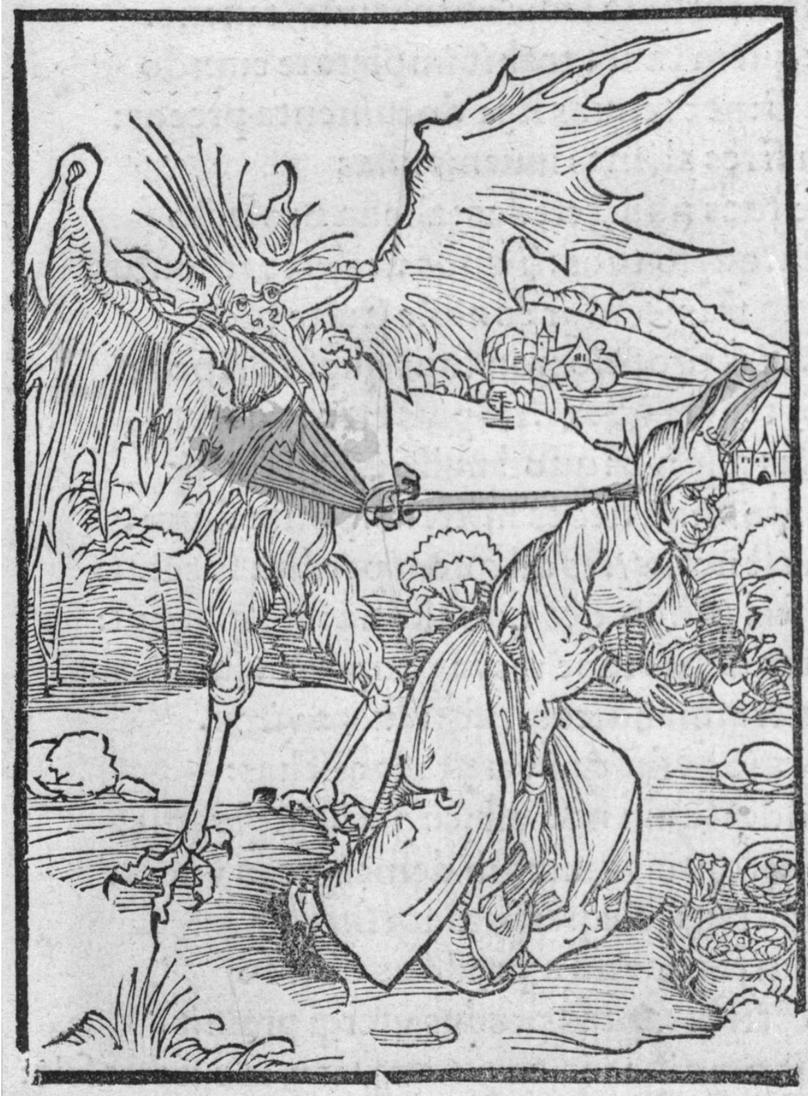
Rem alienam invenire et non reddere. BRANDT, Sebastian, Stultifera navis, Bâle : J. Bergman de Olpe, 1497

http://www.biusante.parisdescartes.fr/histmed/image?04396