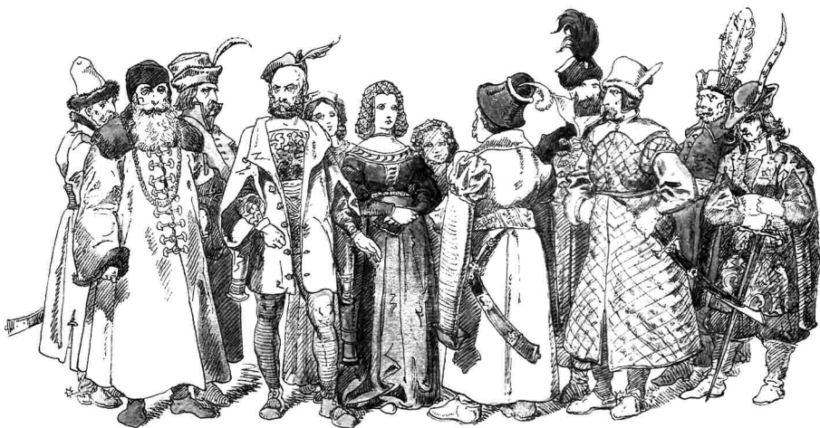
JAN MATEJKO, UBIORY W POLSCE 1200-1795 , 1875