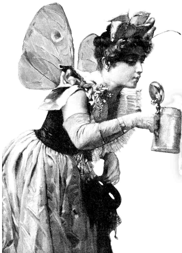
ILLUSTRIERTES UNTERHALTUNGSBLATT : WÖCHENTLICHE BEILAGE ZUR THORNER OSTDEUTSCHEN ZEITUNG. 1902, № 6