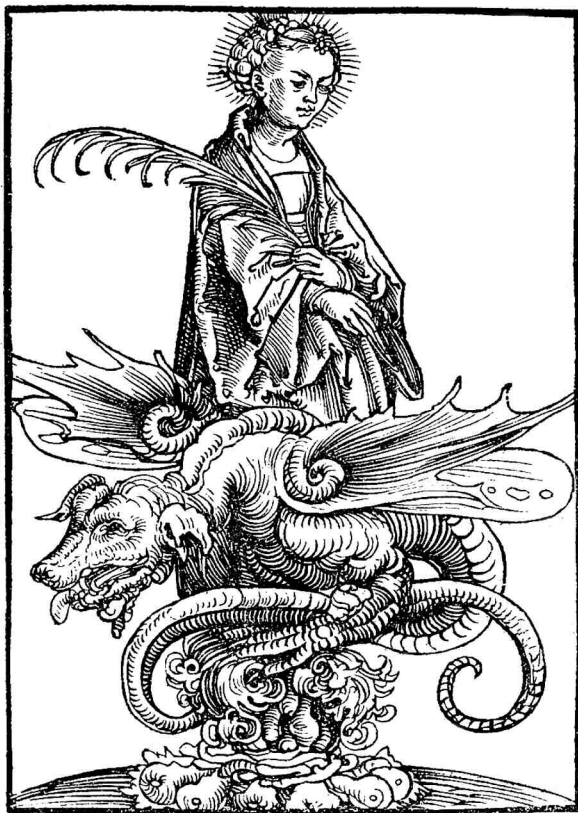
DYE ZAIGUNG DES HOCHLOBWIRDIGEN HAILIGHTHUMS DER STIFT KIRCHEN ALLER HAILIGEN ZU WITTENBURG, 1509 (IL. LUCAS CRANACH)