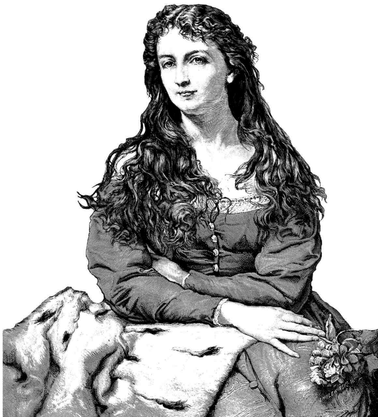
JAN MATEJKO, ALBUM JANA MATEJKI, 1876