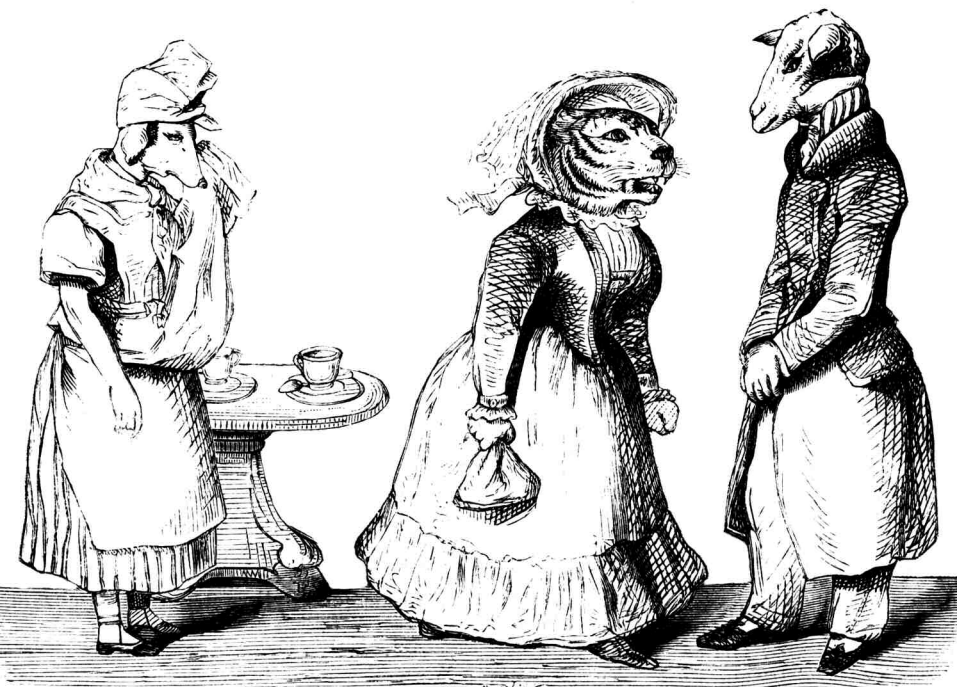
OPIEKUN DOMOWY. R.7, SERJA 2, № 50 (13 GRUDNIA 1871)