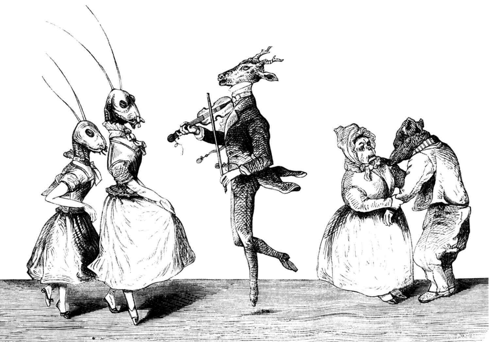
OPIEKUN DOMOWY. R.7, SERJA 2, № 49 (6 GRUDNIA 1871)