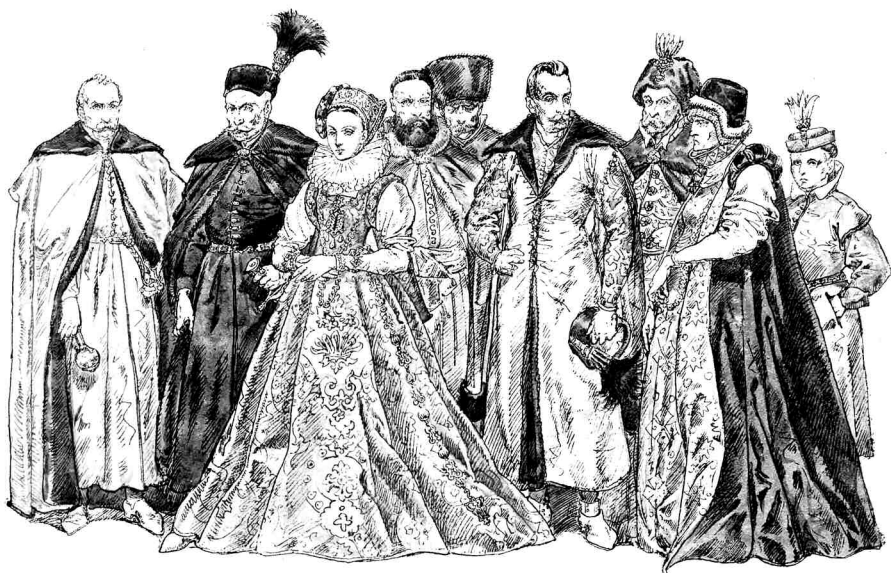
JAN MATEJKO, UBIORY W POLSCE 1200-1795 , 1875