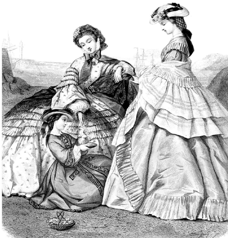
MAGAZYN MÓD I NOWOŚCI DOTYCZĄCYCH GOSPODARSTWA DOMOWEGO. 1861, № 17