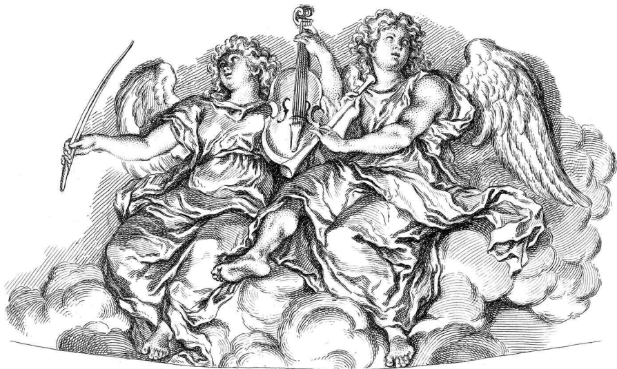
DESCRIPTION HISTORIQUE DE L'HOTEL ROYAL DES INVALIDES, 1756