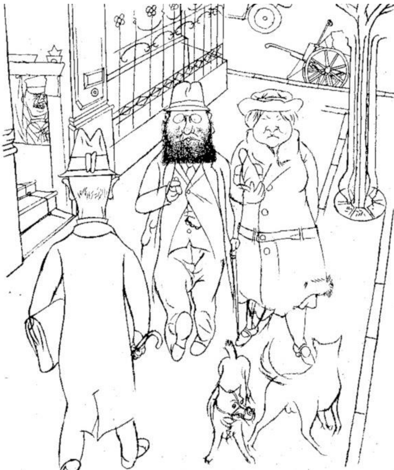
Grosz, George. Über Alles Die Liebe: Zeichnungen, Bruno Cassirer. 1930.