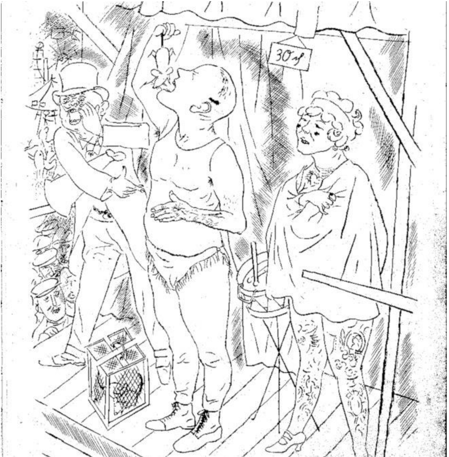
Toller, Ernst, and George Grosz. Brokenbrow, a Tragedy . Nonesuch Press, 1926.