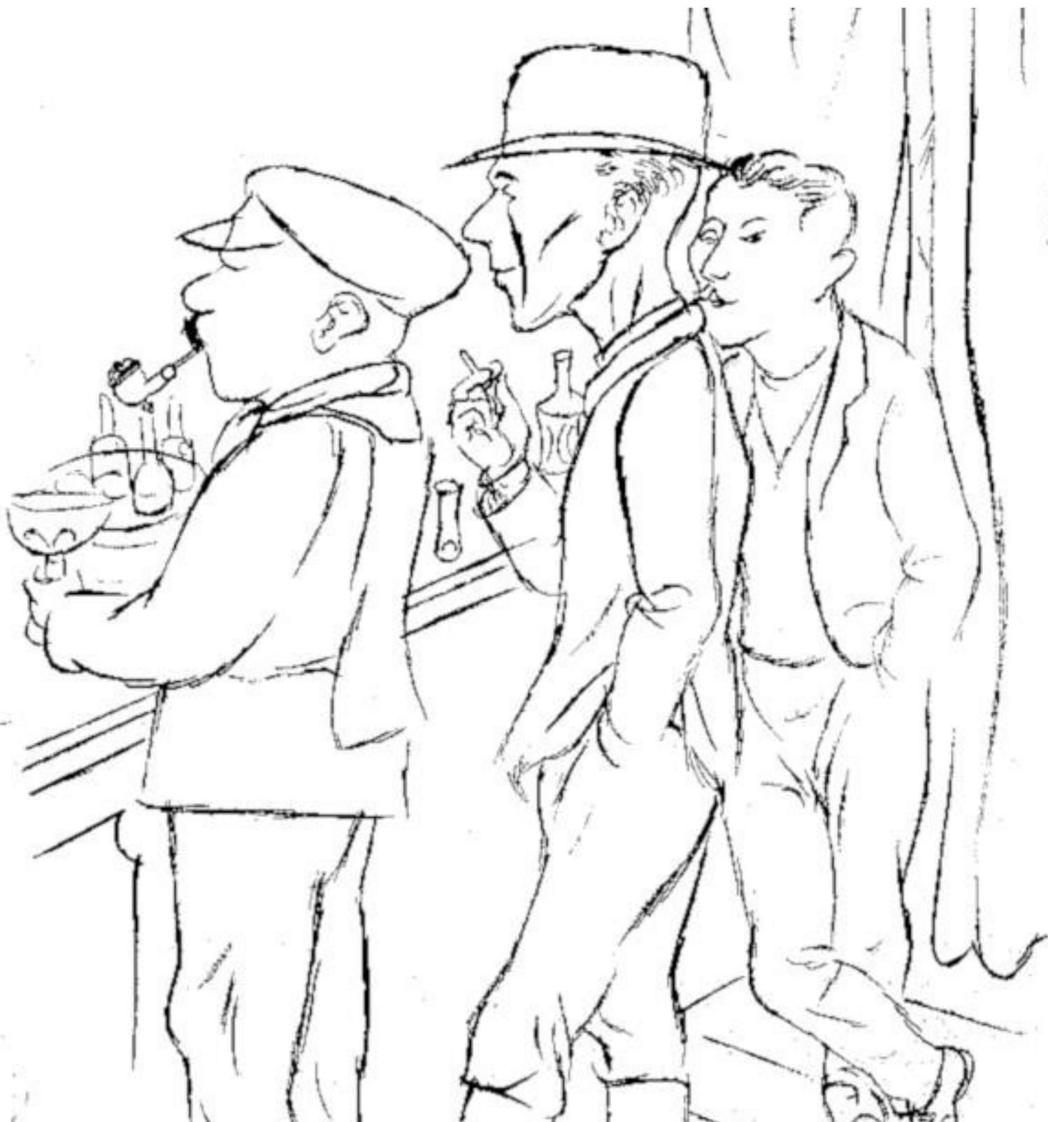
Toller, Ernst, and George Grosz. Brokenbrow, a Tragedy. Nonesuch Press, 1926