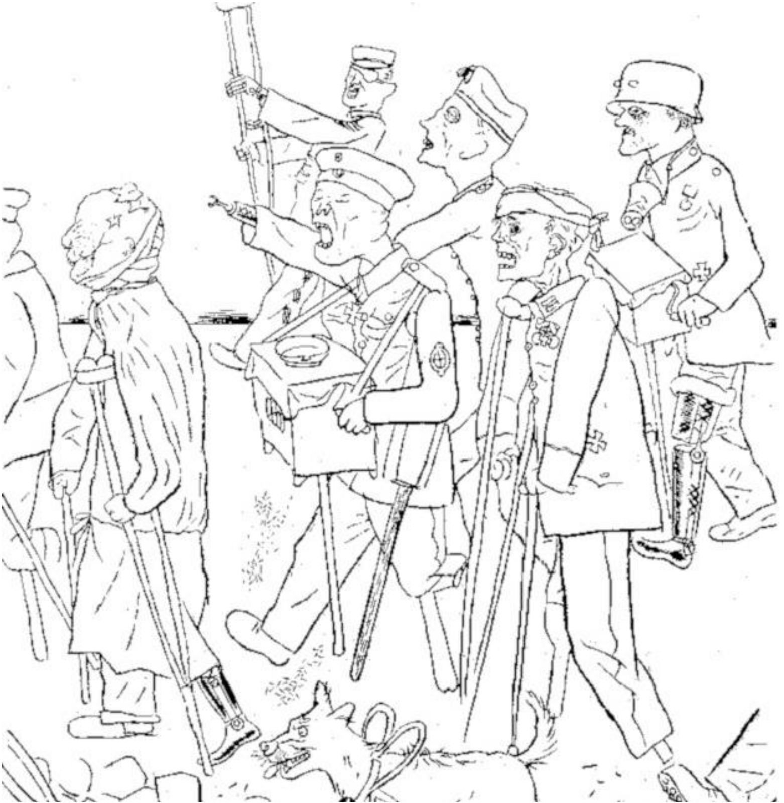
Toller, Ernst, and George Grosz. Brokenbrow, a Tragedy. Nonesuch Press, 1926