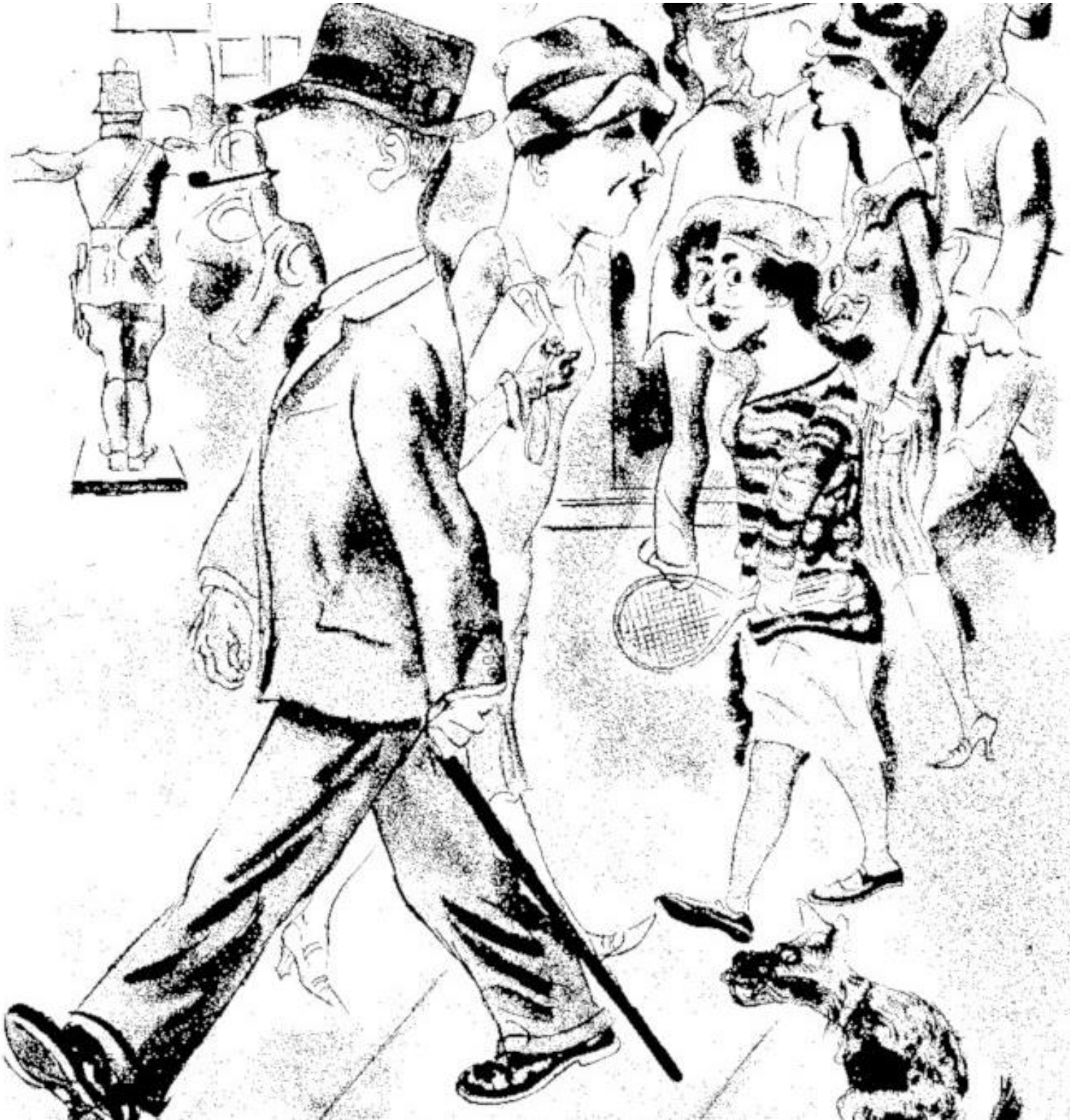
Grosz, George. Über Alles Die Liebe: Zeichnungen, Bruno Cassirer. 1930.