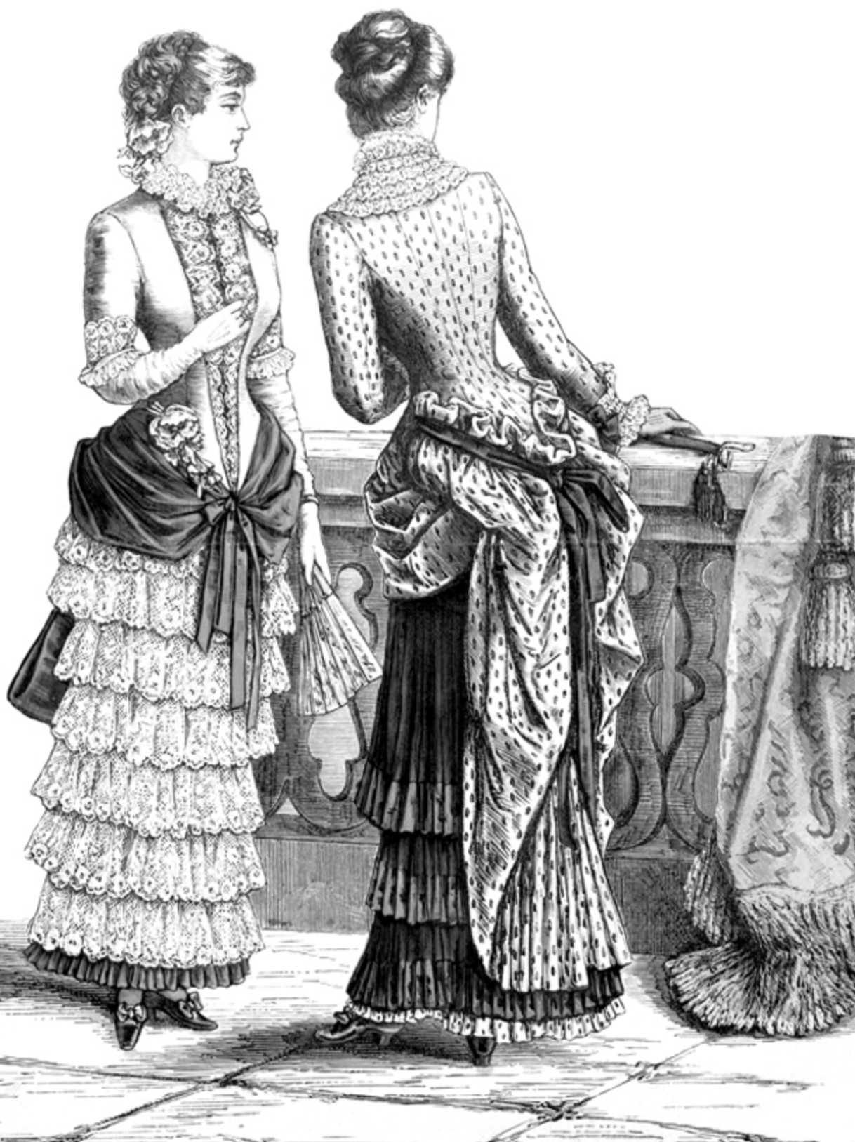
TYGODNIK MÓD I POWIEŚCI: Z DODATKIEM ILLUSTROWANYM UBRAŃ I ROBÓT KOBIECYCH. 1882, NO 24 (17 CZERWCA)