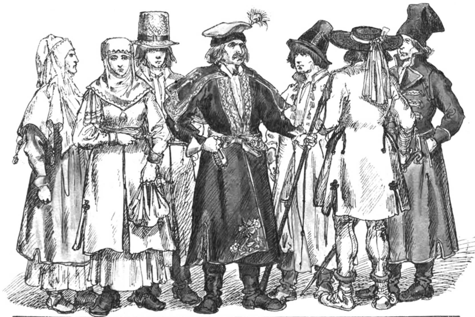
JAN MATEJKO, UBIORY W POLSCE 1200-1795, 1875