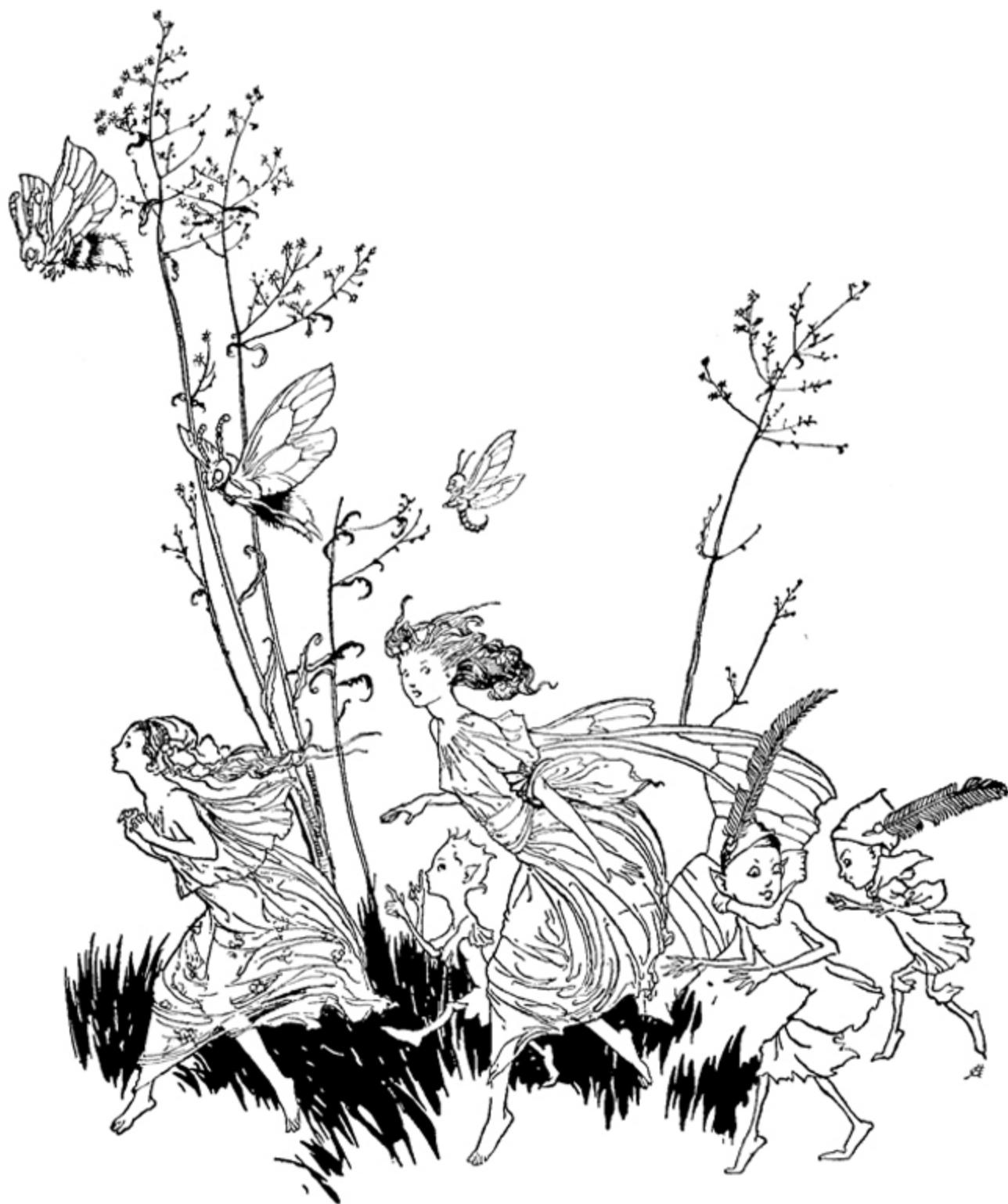
JAMES BARRIE, PRZYGODY PIOTRUSIA PANA, 1914