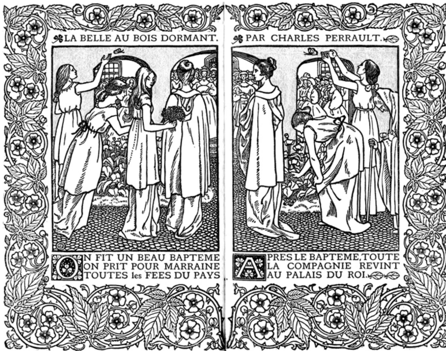
CHARLES PERRAULT, LA BELLE AU BOIS DORMANT; LE PETIT CHAPERON ROUGE: DEUX CONTES DE MA MERE L'OYE, 1899