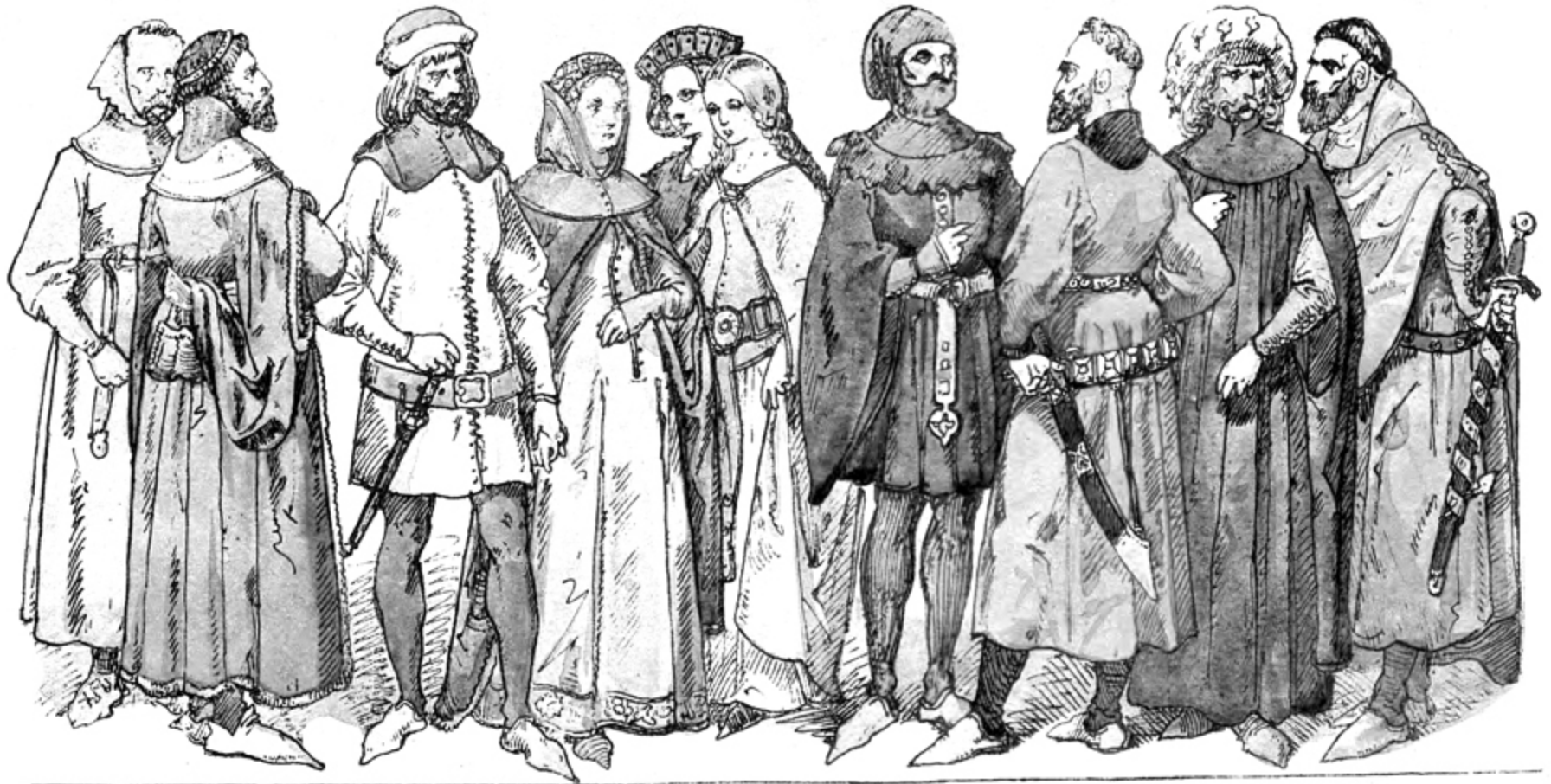
JAN MATEJKO, UBIORY W POLSCE 1200-1795, 1875