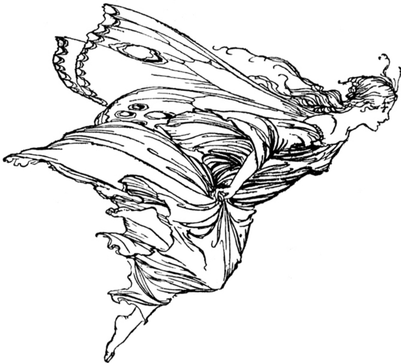
WILLIAM SHAKESPEARE, A MIDSUMMER NIGHT'S DREAM, 1908