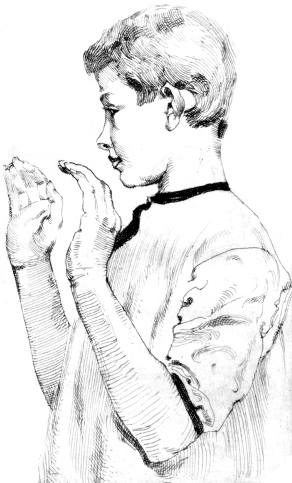
JÓZEF MEHOFFER, PORTRET CHŁOPCA, 1910