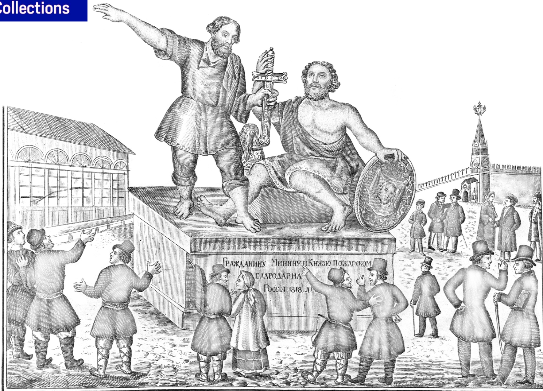
Дож. деваур. Москва, 18 января 1889 г.