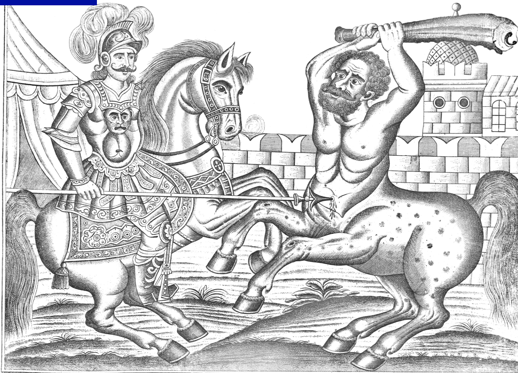
Деволано Целурон Москва, 1861 года. Литография В. Васильева. 1 Бороздистого жиста, 2 Мистава... Славный сильный и храбрый Бова Королевич поражает Полкана Богатыря.

Альбом цветных литографий «Русский лубок» (Images et Dessins populaires russes jusqu'à 1860)