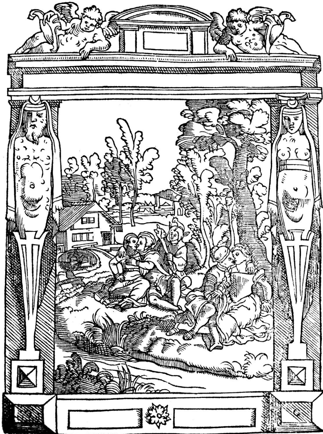
De Damhouder, Josse, Praxis rerum criminalium , Anvers : Jean Bellère, 1554, cote bmi Épinal : 16° in-8/26492 P/R