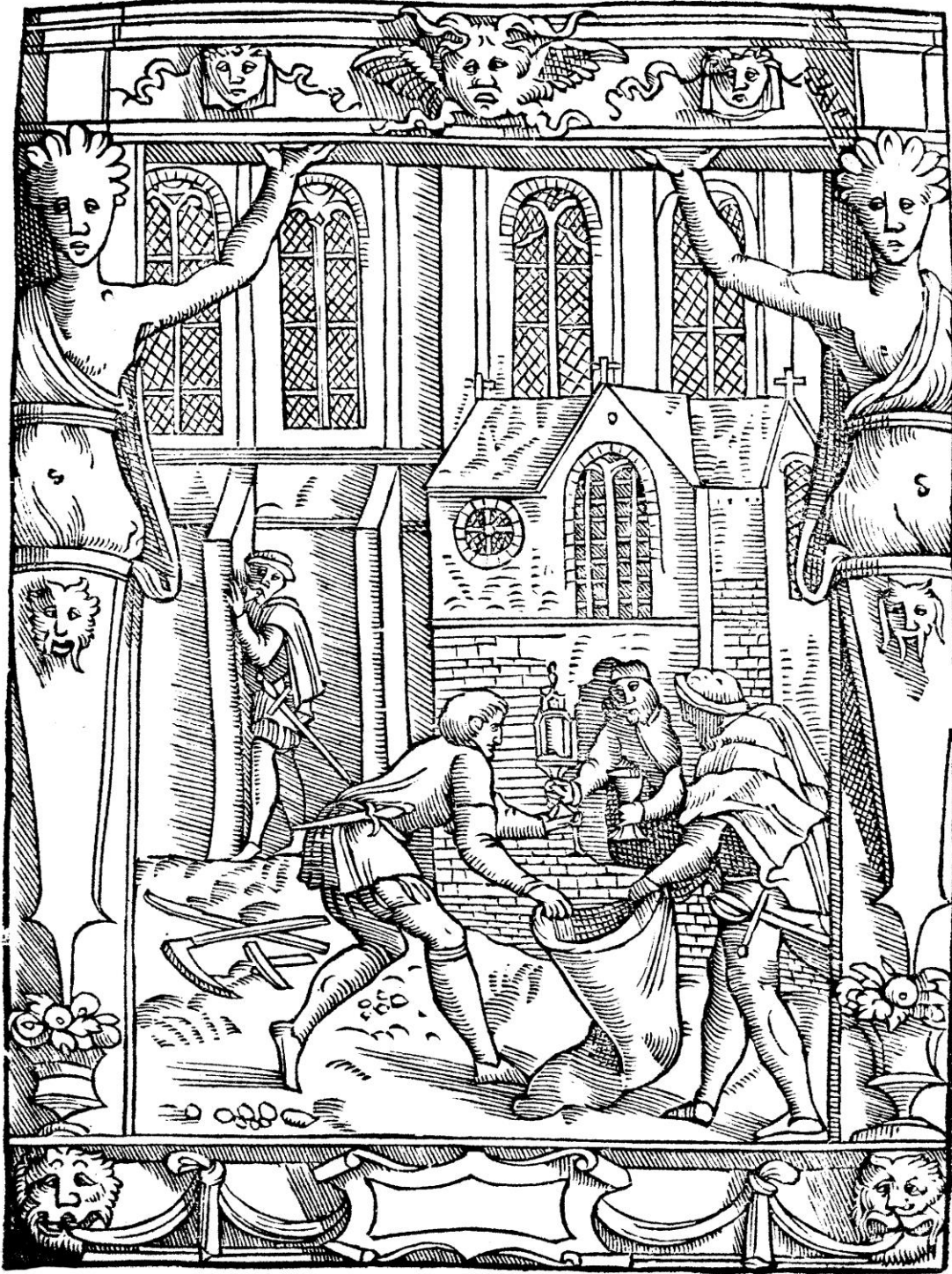
De Damhouder, Josse, Praxis rerum criminalium , Anvers : Jean Bellère, 1554, cote bmi Épinal : 16° in-8/26492 P/R