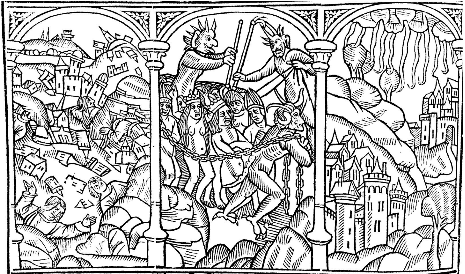
Les Figures du Vieil Testament et du Nouvel , Paris : Gilles Cousteau, 1504, cote bmi Épinal : 16 e in-8/AR3-56 P/R