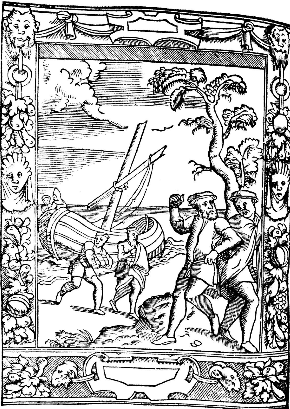
De Damhouder, Josse, Praxis rerum criminalium , Anvers : Jean Bellère, 1554, cote bmi Épinal : 16° in-8/26492 P/R