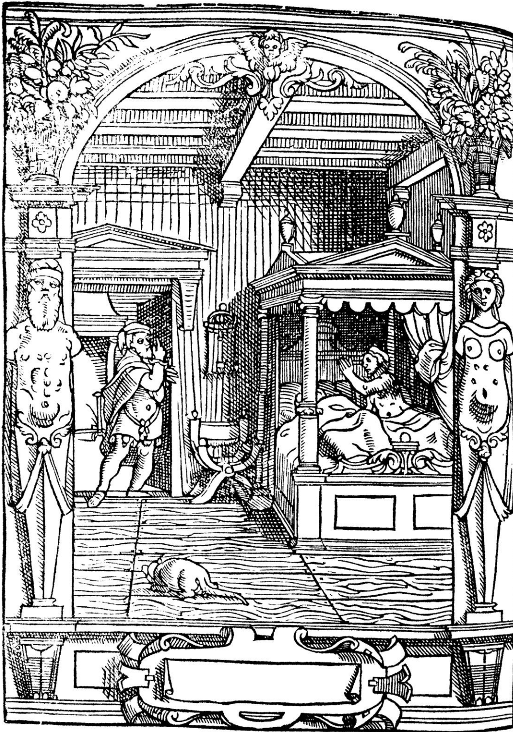
De Damhouder, Josse, Praxis rerum criminalium , Anvers : Jean Bellère, 1554, cote bmi Épinal : 16° in-8/26492 P/R