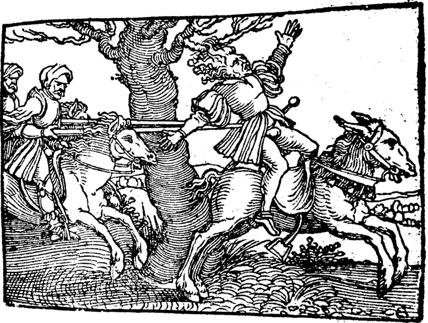
Biblia veteris testamenti et historie, artificiosis picturis effigiata , Francfort : Christian Egenolff, 1557, cote bmi Épinal : 16° in-16/AR1-212 P/R