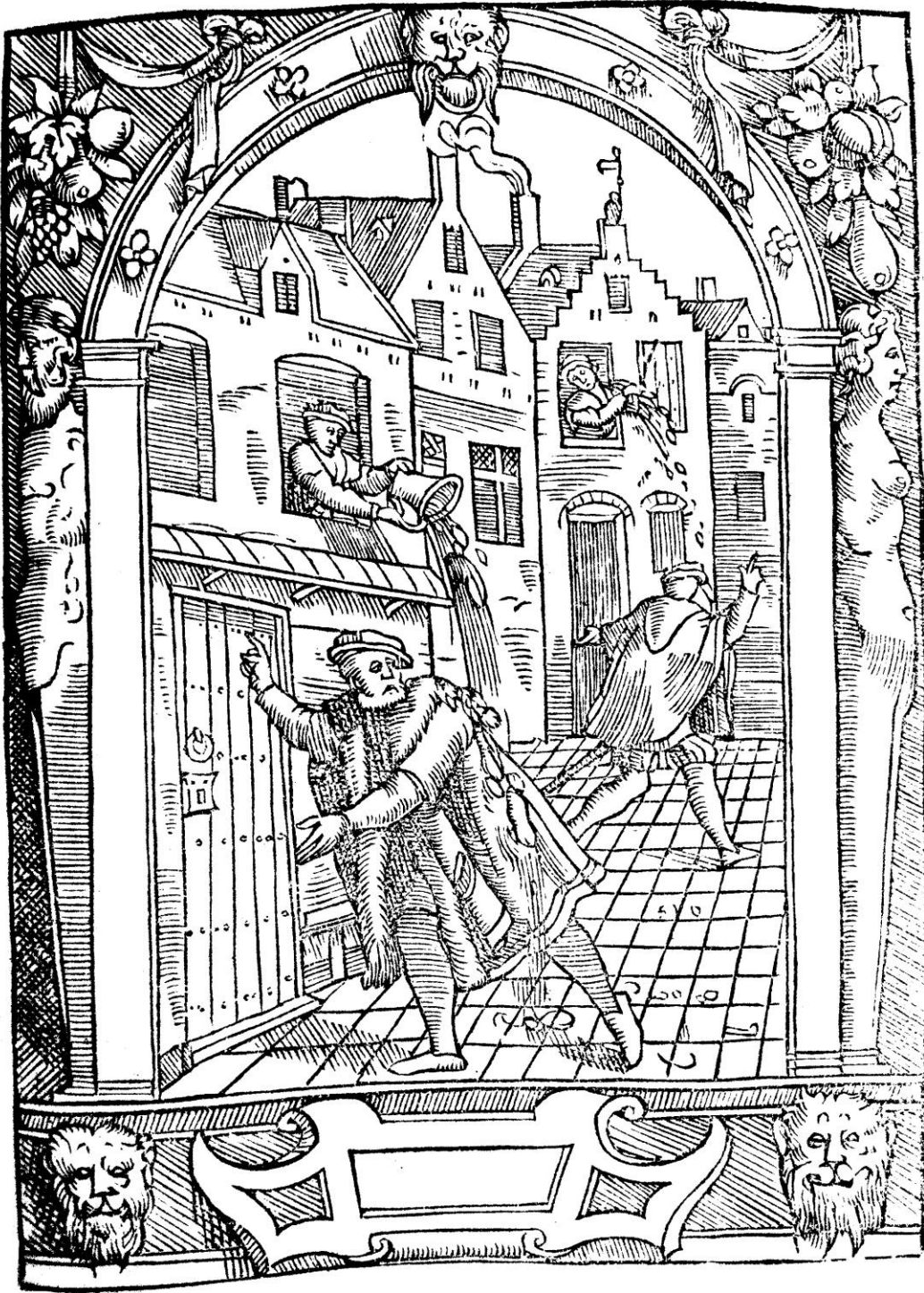
De Damhouder, Josse, Praxis rerum criminalium , Anvers : Jean Bellère, 1554, cote bmi Épinal : 16° in-8/26492 P/R