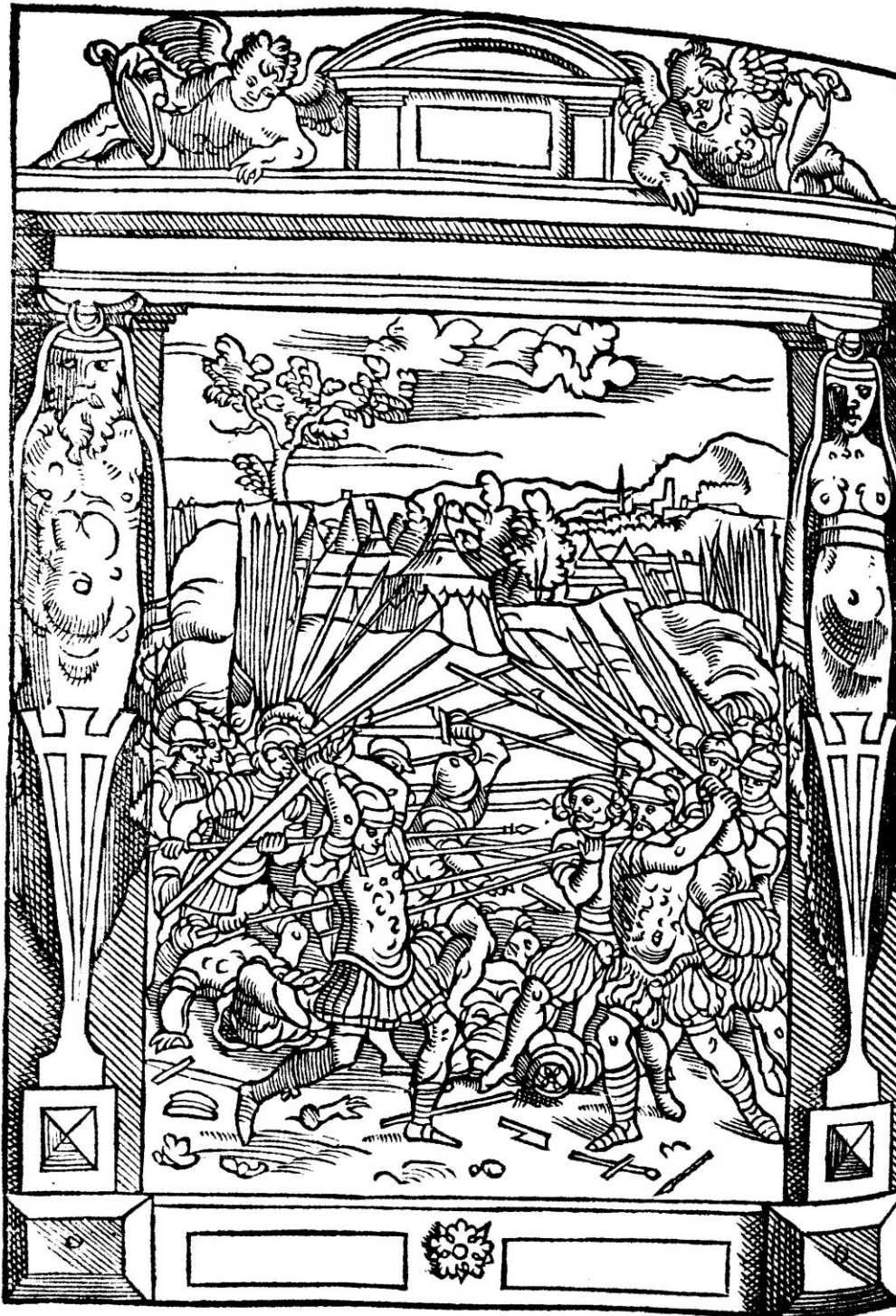
De Damhouder, Josse, Praxis rerum criminalium , Anvers : Jean Bellère, 1554, cote bmi Épinal : 16° in-8/26492 P/R