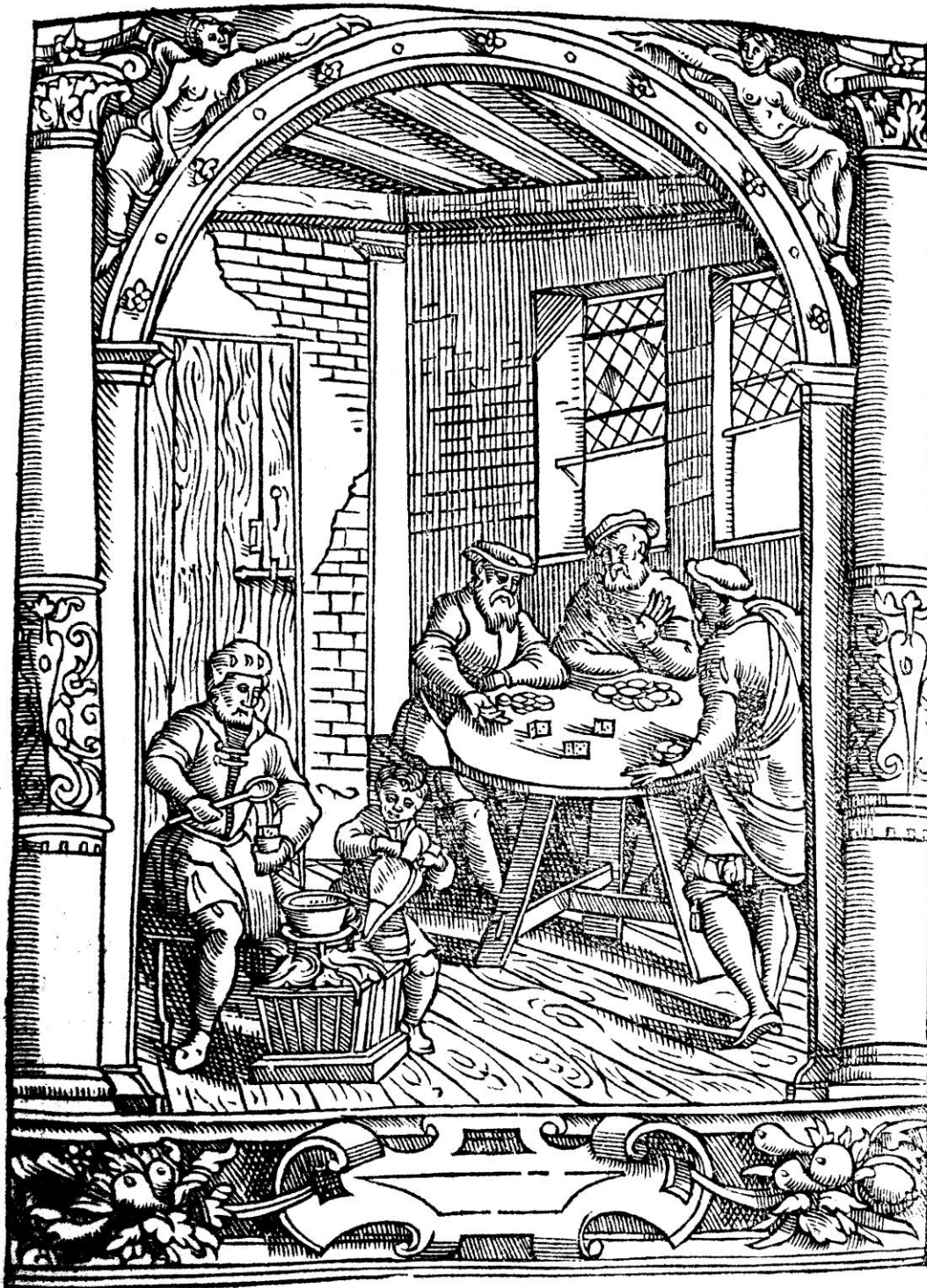
De Damhouder, Josse, Praxis rerum criminalium , Anvers : Jean Bellère, 1554, cote bmi Épinal : 16° in-8/26492 P/R