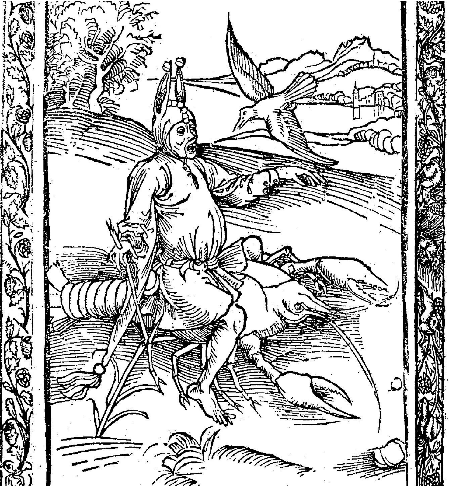
Geiler von Kaysersberg, Johann, 1445-1510. Naucula siue speculu[m] fatuor[um] ... Joannis Geyley Keysersbergii ... in sermones iuxta turmarum seriem diuisa ... a Jacobo Othero diligenter collecta. Compendiosa vite eiusdem descriptio, per Beatum Rhenanum Selestatinum. ([Strasbourg] : [Johann Prüss], [1511]). Call Number: Union Rare WT5 G312 1511