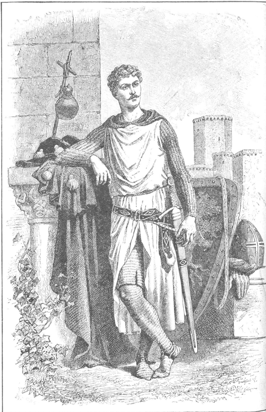
Wilfred of Ivanhoe.

«Айвенго», Вальтер Скотт (1900) / Ivanhoe by Sir Walter Scott (1900) Иллюстрация «Уилфред Айвенго» The illustration Wilfred of Ivanhoe